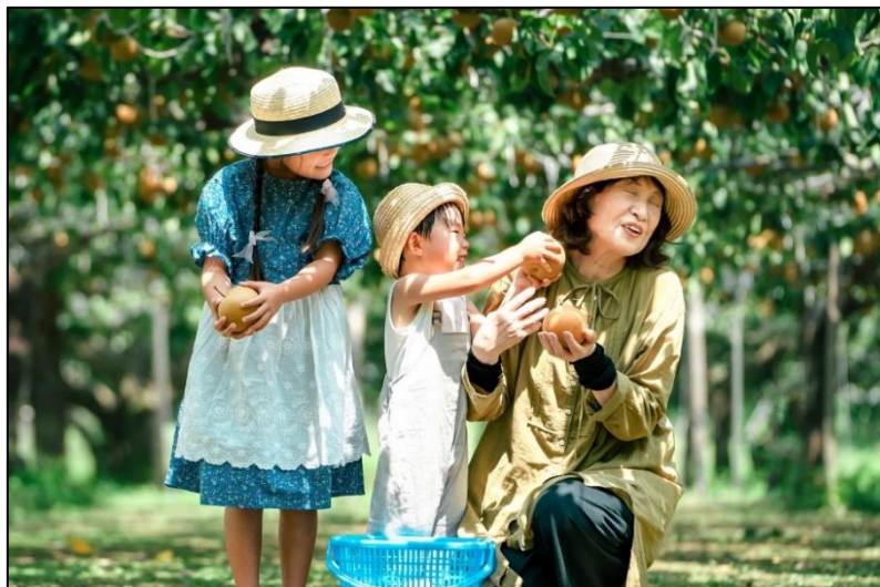
グランプリ作品「わいわい梨狩り」