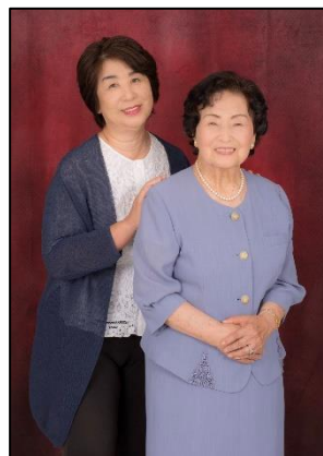
クリアン賞作品 「仲良し親子」