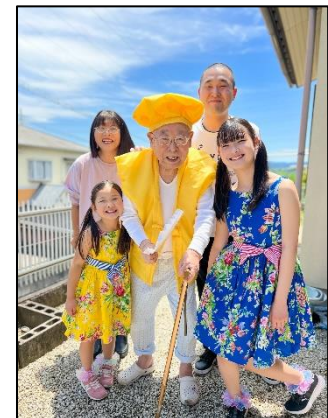
クリアン賞作品 「ひいおじいちゃん! 米寿おめでとう!」

他、きずな賞に5作品、優秀賞に10作品を選出しています。 全受賞作品と各審査員のコメントは結果発表ページからご覧ください。