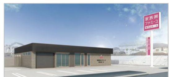
ホール外観イメージ

URL： https://www.familie-kazokusou.com/search_area/aichi/nagoyashi/post-1674.html