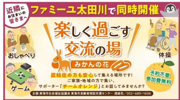
「みかんの花」ポスターデザイン（一部抜粋）